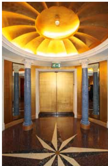
La Rotonde du Richmond avec son plafond or et ses pilastres en stuc.