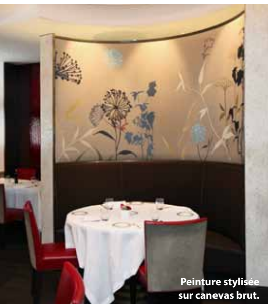
Peinture stylisée sur canevas brut.