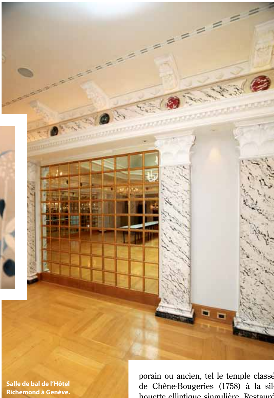
Salle de bal de l'Hôtel Richmond à Genève.

L a salle de bal de l'Hôtel Richmond, à Genève? 360 mètres linéaires de moulures à la feuille d'or patinée, ponctuées de médaillons de faux marbre rouge royal, noir Portor et vert de mer, les croisillons de la porte miroitante dorés sur fond rouge pour en accentuer le relief... En cohésion, la Rotonde, antichambre des grands salons, s'offre, élégamment magique, avec ses revêtements d'or sur fonds de plâtre et de bois, ses pilastres en stuc imitation marbre. Au sein de cet ancien palace recréé dans une atmosphère contemporaine en 2007, le restaurant donnant sur le parc Brunshwig s'éprend d'inspirations végétales: deux grands tableaux de fleurs stylisées sont peints sur canevas brut. Exempte de solvant,