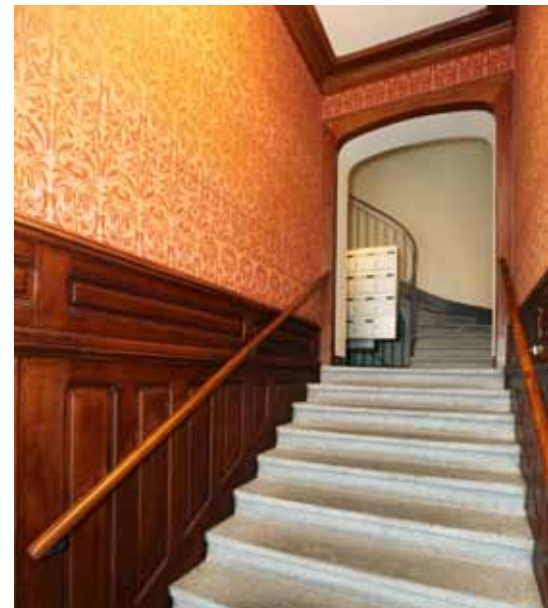
Peinture damassée dans un hall d'immeuble aux Eaux-Vives à Genève.

dévoilent une parfaite harmonie grâce à la peinture de faux bois savamment adaptée au bois de chêne existant.